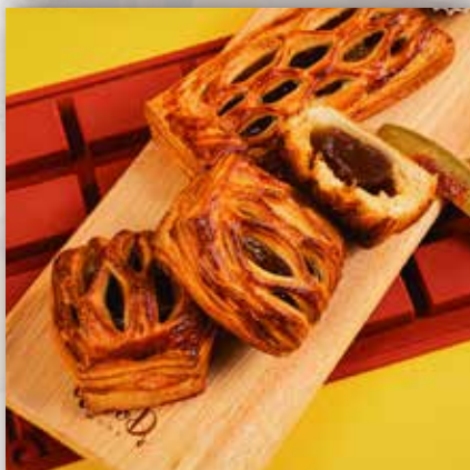
봉쥬르 꿀 페스츰리