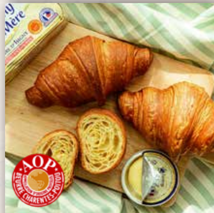
발효냉동 A.O.P 크로와상